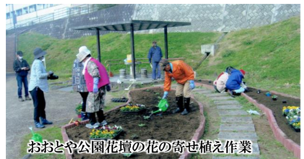
おおとや公園花壇の花の寄せ植え作業

悠々クラブ青葉会は、青葉苑町内会と隣接するさつき町内会のメンバー構成で活動しています。今年度はコロナ感染拡大防止の観点から活動は自粛せざるを得ない状況ですが、屋外での行事活動の「おおとや公園」花壇植栽整備清掃は通常通りに4~11月まで8回、また健康ウォーキングは春・秋と2回、秋に開催の「日帰り親睦旅行会」の行事活動は実施してまいりました。 コロナウイルスの早い終息を願い、好日庵で普段通りのサークル活動ができるよう祈っています。