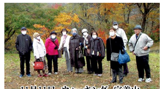
11月11日 ウォーキング 定義山

結成して20年、当時会員になられた方々はベテラン会員として活動されていきます。今年は何をするにも自粛、3密を避けるように心がけてきました。今、活動している民謡、太極拳、健康マージャンは時間を短縮して、また、サロンやすこやかクラブは回数を抑えて行っています。いつもは盛り上がるサロンも皆さん控えめです。これからも今できることを話し合いながら取り組んでいきたい。 このコロナ禍が終息したら体力測定やスポーツセミナーに積極的に参加して会員の健康づくりに役立てていきたいと思っております。