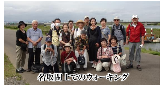
名取閑上でのウォーキング

当会の例年の活動は、総会、新年会、お茶会(年2~3回)、ウォーキング、会報の配布(毎月)、さらに3年前から始めた有志による地下鉄八木山動物公園駅東口花壇の管理が主な内容ですが、去年はウォーキングと会報の発行、花壇の管理のみでした。9月に名取市閑上に行き、震災メモリアル公園、震災復興伝承館、かわまちてらすを訪れ、改めて被災の大きさを実感しました。また、11月には、野草園を訪れ、秋晴れの下、散策したり、マスクをつけて合唱したりして楽しいときを過ごしました。 早くコロナウイルスが終息し、楽しく語り合える日の来ることを願っております。