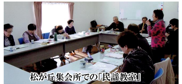
松が丘集会所での「民謡教室」

「松の実会」は、松が丘町内会にあり、会員数は45名で活動しております。サークルは6つありますが今回は民謡教室の活動を紹介します。毎月第二・第四の木曜日、午後1時から3時までの2時間の練習となります。特長は、三味線・尺八・お囃子がついていることで唄の上達が早くしっかりと勉強できることです。総勢9~10名で毎回練習しております。老人ホーム、ディサービス等の慰問活動もしております。