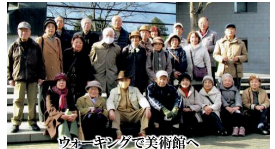
ウォーキングで美術館へ

「本町二丁目楽友会」は、八木山本町二丁目町内会にある老人クラブです。会員数は88名で、会員を14班に分け、14人の班幹事で活動。毎月会員に配布しています「楽友会たより」は老人クラブ発足以来続いており、今月の1月号で277号になりました。 懸念されてますコロナウイルスも4月よりワクチンが接種される予定とのこと、一日も早くサークル活動・諸行事が再開されることを祈っております。